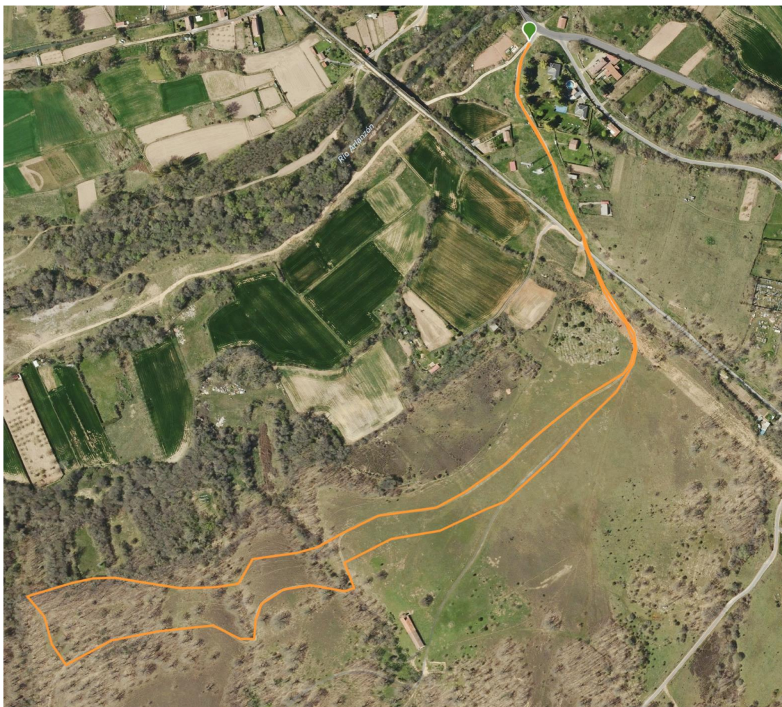
Canicross Popular 2,5 km + 16m

*Los mapas son aproximados pudiendo sufrir pequeñas variaciones