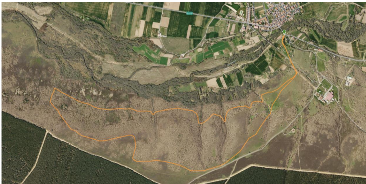
Bikejoring / Canicross Corto 7,2 km +88m